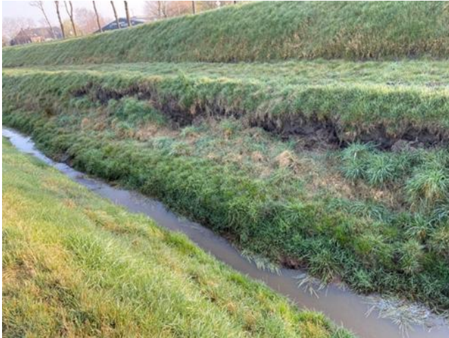
Figuur 2: Schade aan sloottalud bij de Borgsloot als gevolg van slechte microstabiliteit binnenwaarts. Vond plaats tijdens hoogwater in 2022.