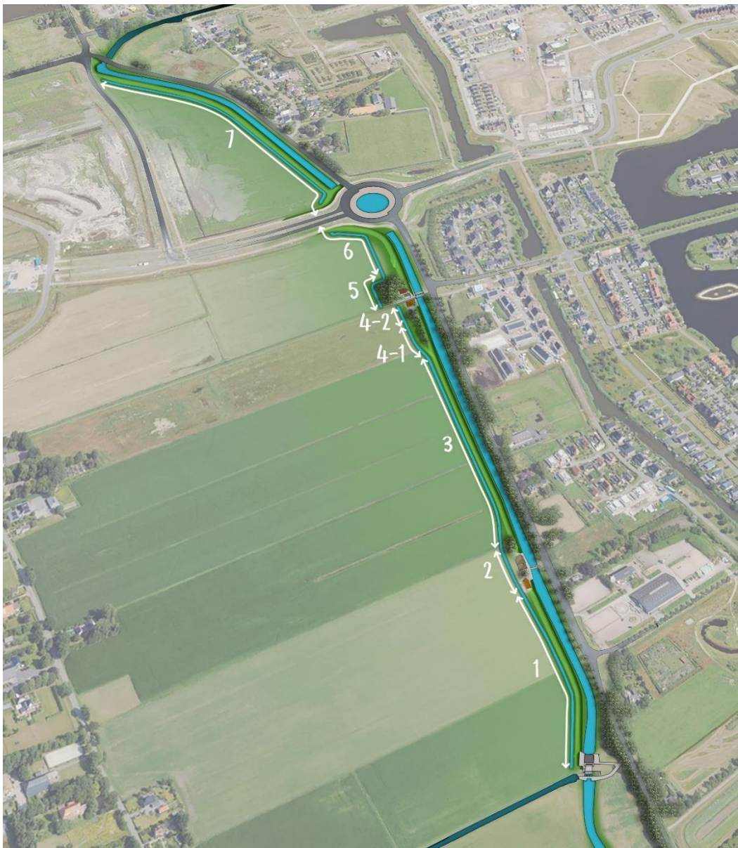
Figuur 1: Trajectoverzicht kadeversterking Borgsloot incl. dijkvakken

Het projectplan heeft inmiddels ter inzage gelegen en wordt nu ter besluitvorming voorgelegd aan het algemeen bestuur.