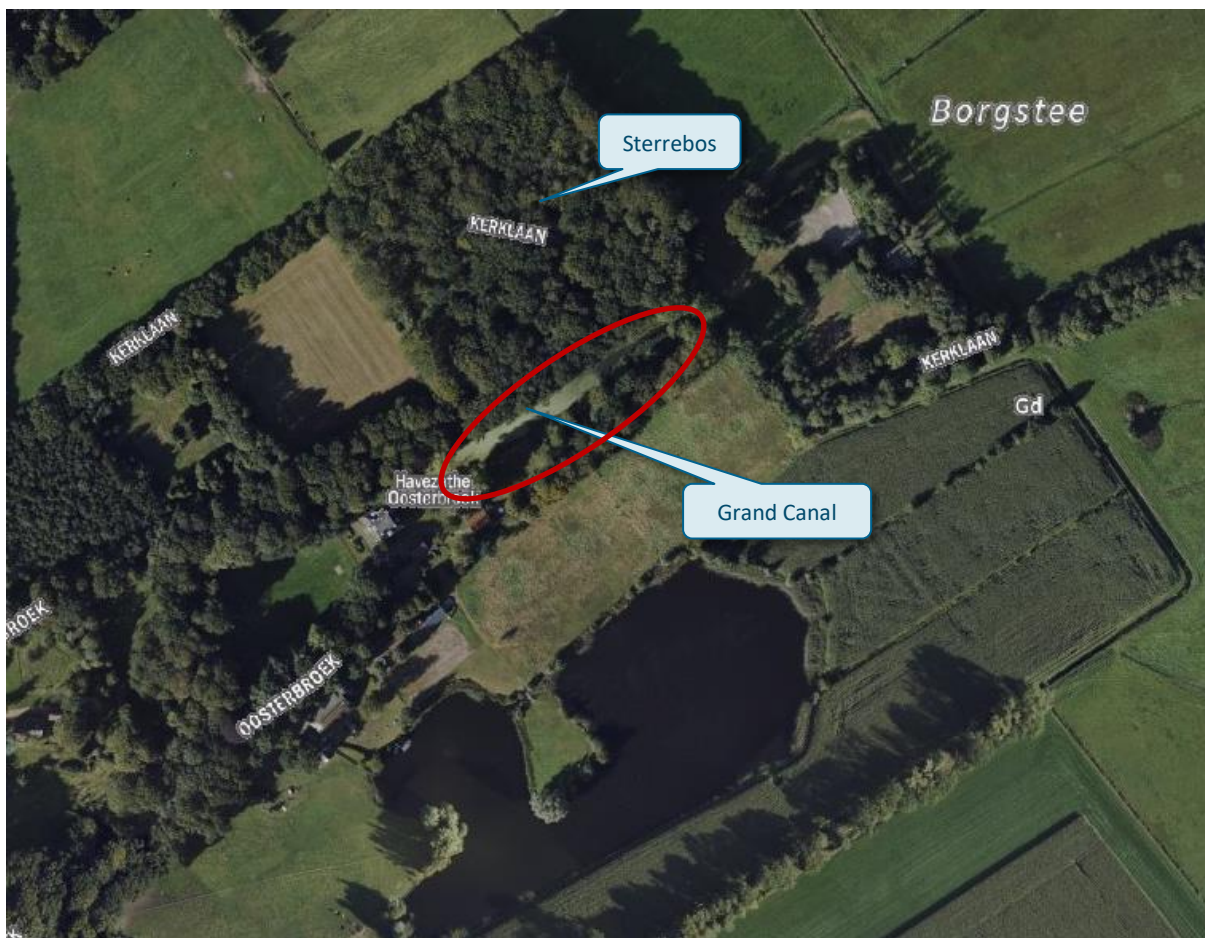
Figuur 3.3: Onderdelen van het beschermd dorpsgezicht

verduikeren van de sloot (optie benoemd tijdens de schetssessies t.b.v. voorkomende schade bever) een negatieve impact. Die werkzaamheden vallen echter buiten de begrenzing van het beschermd dorpsgezicht, maar hebben wel een dubbelbestemming 'waarde – beekdal'. Alsnog dient deze impact gecompenseerd of gemitigeerd te worden. Er is naar verwachting geen grond de vergunningen op het onderdeel beschermd dorpsgezicht te weigeren. Voor zover voor meerdere werken en/of werkzaamheden vergunningen worden gevraagd en deze in één (inrichtings)plan zijn ondergebracht, wordt dit plan in zijn geheel in de beoordeling betrokken.