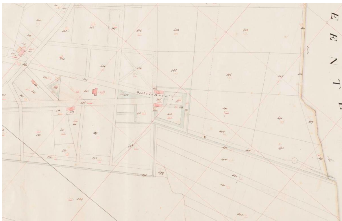
Figuur 3.2: Kadastrale minuutplan uit 1832. Toen nog was de vijver als gelijkbenige driehoek aangelegd. Roodbeen herontwierp deze vijver in 1836 als slingerende langwerpige vijver (zoals thans nog aanwezig).

Waarde – Beekdal: De vergunning is voor alle dijkvakken benodigd. Verwacht wordt dat de verlening van deze vergunning vanuit cultuurhistorisch / landschappelijk perspectief niet problematisch is. Immers betekent het versterken van de kades (waar ophoging in de regel onderdeel van uit maakt) weinig voor de wezenlijke kenmerken (kleinschaligheid, meanderende beken en de algemene karakteristiek met bossen, essen en heides). Wel heeft het