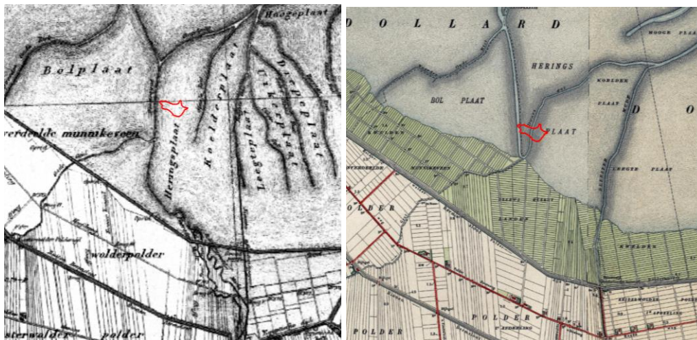
Afbeelding 2. Het plangebied op de topografische militaire kaart (TMK) uit 1850 (l) en 1915 (r)

De gemeente Oldambt heeft haar eigen archeologische beleidsadvieskaart en erfgoedverordening 2 , waarop wordt aangegeven of en in welke vorm er onderzoek noodzakelijk is. Voor het plangebied wordt aangegeven dat er een lage archeologische verwachtingswaarde geldt. Wel loopt dwars door het plangebied een cultuurlandschappelijk waardevolle waterloop. Dit betreft de Oude Geut, één van de laatste natuurlijk waterlopen die door de Dollardboezem loopt. 3 De Oude Geut zorgde voor de afwatering op de Dollard. De historische (Middeleeuwse) loop van de Oude Geut liep echter ten oosten van het plangebied (zie ook afb.1), waar het uitkwam op het krekken en prielensysteem van de Eems. De huidige loop, ten noorden van de zeedijk, verschijnt in het begin van de 20 e eeuw in het kaartbeeld