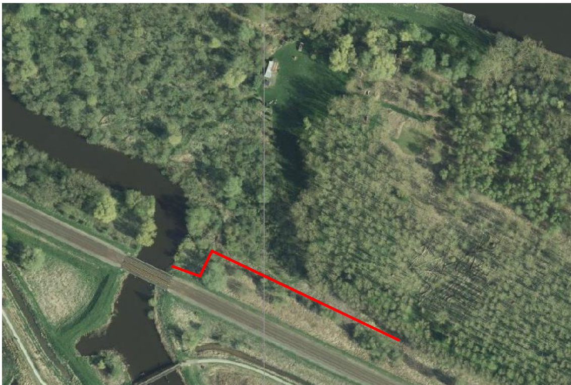
Figuur 4-2: Locatie amfibieënscherm (Globespotter, 2019).