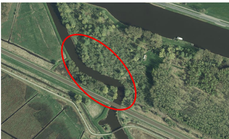
Figuur 4-1: Deel van de kade van het Drents Diep dat gecontroleerd moet worden op holen van de bever (Globespotter, 2019).