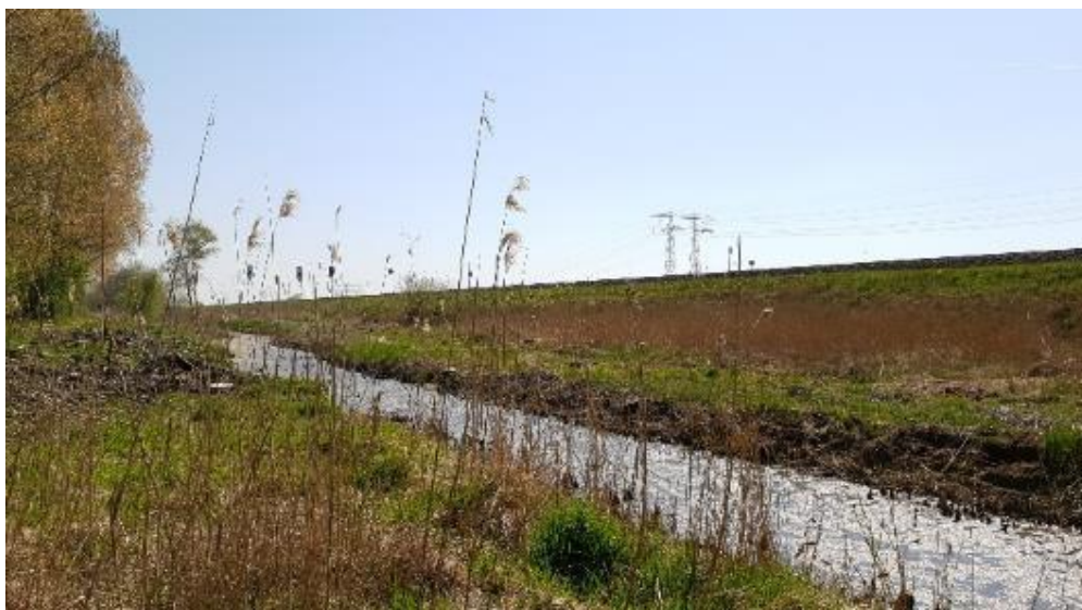
Figuur 3-1: Zuidelijke sloot, leefgebied van heikikker en mogelijk poelkikker.

In het plangebied komen verschillende amfibieën voor. Het gaat hierbij om: Gewone pad, kleine watersalamander, bruine kikker, bastaard kikker en heikikker en mogelijk poelkikker. Voor de gewone pad, bruine kikker, bastaardkikker, kleine watersalamander geldt een vrijstelling voor ruimtelijke ingrepen op basis van de 'Verordening Natuurbescherming Provincie Groningen'. Voor de soorten die onder deze verordening vallen is de algemene zorgplicht van toepassing. De heikikker en poelkikker zijn strikt beschermd onder het beschermingsregime 'Habitatrichtlijnsoorten'. Binnen het plangebied kan de heikikker (en mogelijk poelkikker) voorkomen in de zuidelijke sloot (zie Figuur 3-1) en in de nabijheid van deze sloot op het land. Vanaf maart tot en met september kunnen heikikkers (en mogelijk poelkikkers) foeragerend voorkomen op het land. Daarnaast vormt het aanwezige dode hout geschikte schuilplaatsen voor amfibieën. In het protocol worden maatregelen beschreven voor deze soorten om een overtreding van de Wnb te voorkomen.