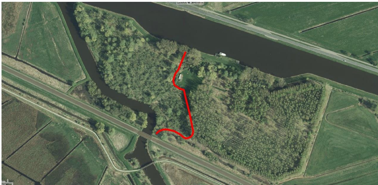
Figuur 1-1: Ligging kadetrace, aangegeven in rood (Globespotter, 2019).