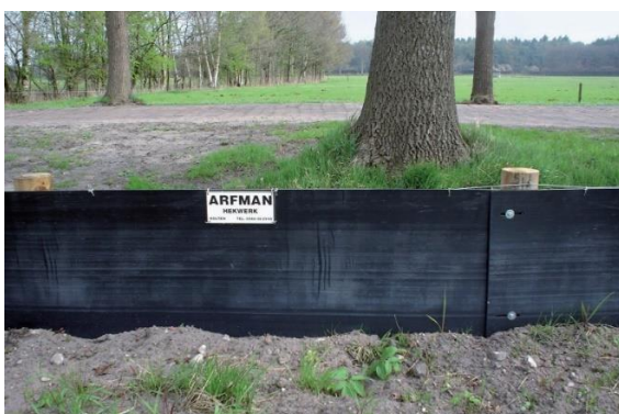
Figuur 4-3: Voorbeeld van een amfibieraster bestaande uit glad kunststof materiaal (Arfman, 2019)