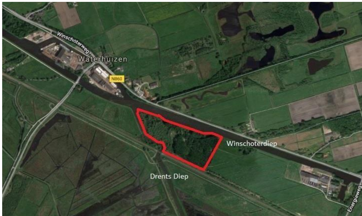
Figuur 1: ligging projectgebied

Het plangebied betreft een bos dat is gelegen in de gemeente Midden-Groningen. Het gebied wordt aan de noordzijde begrensd door het Winschoterdiep, aan de westzijde door het Drents Diep en aan de zuidzijde door de spoorweg Groningen-Winschoten. Ten oosten van het plangebied is sprake van een vochtig graslandperceel. Parallel aan het Winschoterdiep ligt de N860 Rijksweg West. In figuur 2 is de huidige kade met de blauwe lijn weergegeven, waarvan het westelijke deel, in oranje aangegeven, niet meer voldoet. De nieuwe te realiseren kade is in figuur 2 met de rode lijn weergegeven.