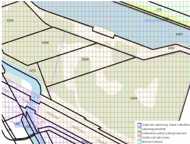
Figuur 8: kaart met bodeminformatie projectgebied

Perceelnr. 3009 en 4264: op deze percelen heeft vroeger een glasproductenfabriek gestaan en ligt ook een stortplaats. Oriënterend en nader bodemonderzoek heeft plaatsgevonden.