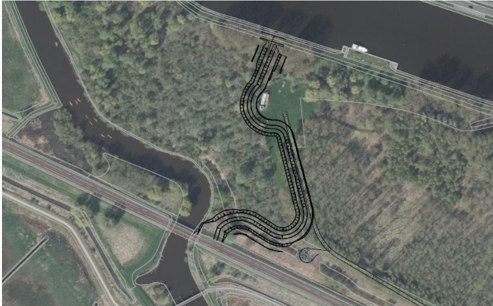
Figuur 3: situering nieuwe kade

Het ontwerppeil (MHW – Maatgevend Hoogwater) van het Drents Diep bedraagt NAP +1,5 m. Dit is de hoogte van de lokale waterstand, er is van uitgegaan dat er geen sprake is van verhoging ten gevolge van scheefstand, windopzet en/of golven. Voor de val na hoogwater is het streefpeil op het Drents diep aangehouden, dit bedraagt NAP +0,53 m (Peilbesluit Eemskanaal Dollardboezem, 8 augustus 2000). Het polderpeil in het achterland is NAP -0,8 m (bron: digitale legger Waterschap Hunze en Aa's).